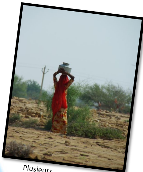
Plusieurs kilomètres parcourus chaque jour pour s'approvisionner en eau, Inde