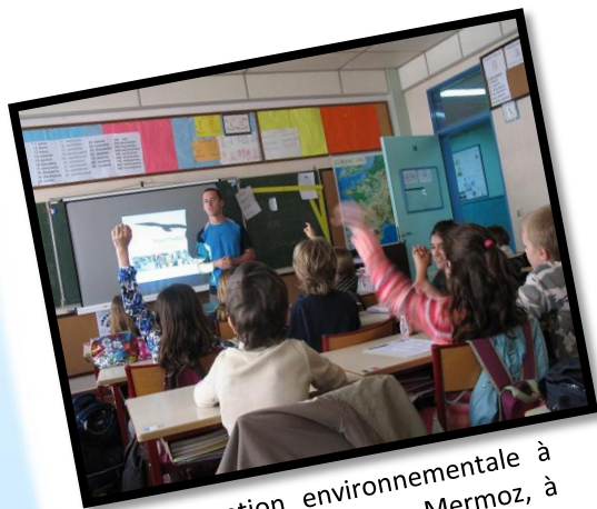
Intervention environnementale à l'école Française Jean Mermoz, à Buenos Aires (Argentine)