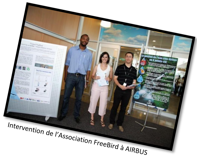
Intervention de l'Association FreeBird à AIRBUS

L'Association FreeBird avait mené une action de sensibilisation à la protection de l'environnement, à l'occasion de la journée mondiale de l'environnement le 5 Juin 2009. En effet, les bénévoles avaient organisé et animé un stand au sein du restaurant d'AIRBUS à Toulouse sur le site Lagardère pour sensibiliser les collaborateurs d'AIRBUS (et leur famille par le biais de prospectus / quizz distribués) à l'économie d'eau en réalisant des gestes simples quotidiens.