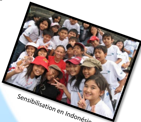
Sensibilisation en Indonésie